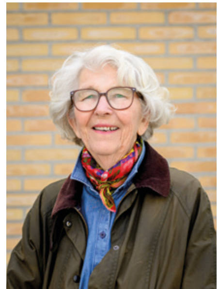
Vestre Porsgrunn kirke Torsdag 19. november kl. 19.00