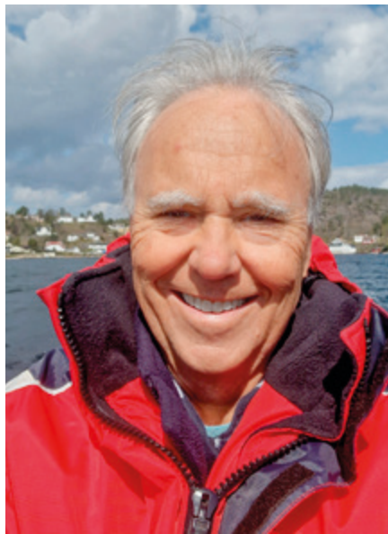
Porselenskirken Torsdag 22. oktober kl. 19.00